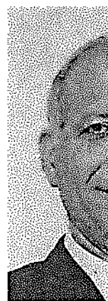
זה שחר זרשר המשפטים

ל התיאטרון ז עקא, שלא נה מאפשרת בריאה והלא