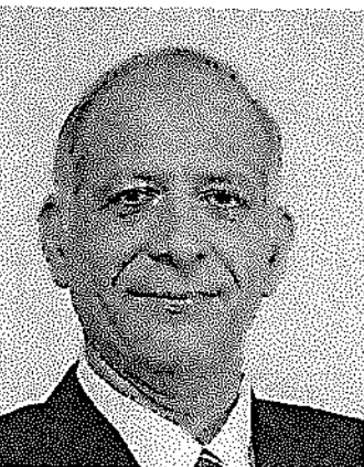
עו"ד שלמה שחר

אם להתייחס בקצרה לאשר נדרש לניהול תקין של התיאטרון בשנים הקרובות, איני רואה מנוס מלהתייחס לנושא ששבתי והתרעתי עליו משך השנים: החוב הנכבד שרובץ על התיאטרון בשל ההלוואה שקיבל בזמנו מהמדינה כחלק מתוכנית ההבראה.